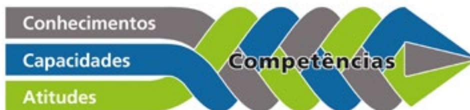
Figura 2 – Esquema conceitual de competência adaptado de “The Future of Education and Skills: OECD Education 2030 Framework”, In: Global competency for an inclusive world , OECD, 2016.

As competências são combinações complexas de conhecimentos, capacidades e atitudes, são centrais no perfil dos alunos, na escolaridade obrigatória. A Figura 2 ilustra este conceito salientando a interligação das três dimensões.